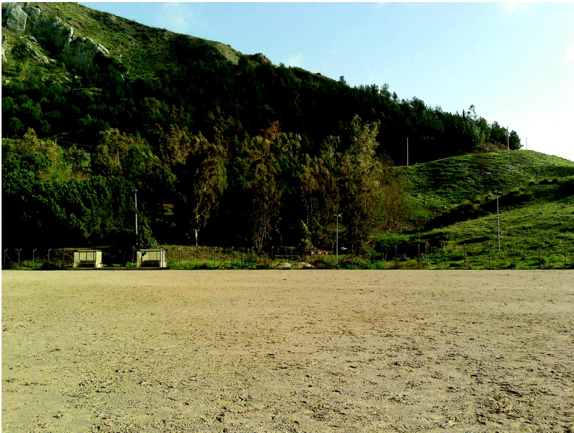
foto n. 5 - scorcio est del campo