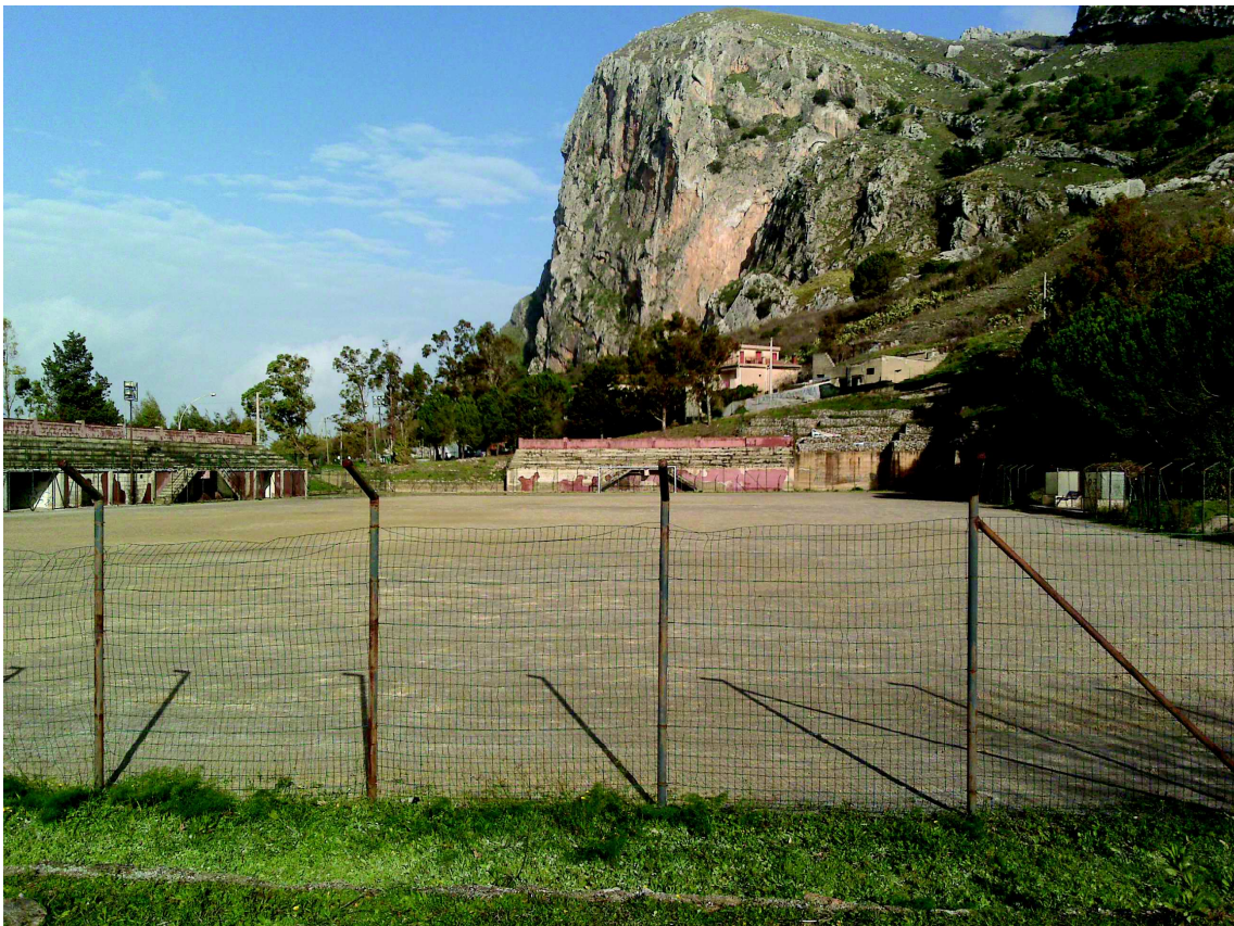
foto n. 2 - scorcio nord del campo