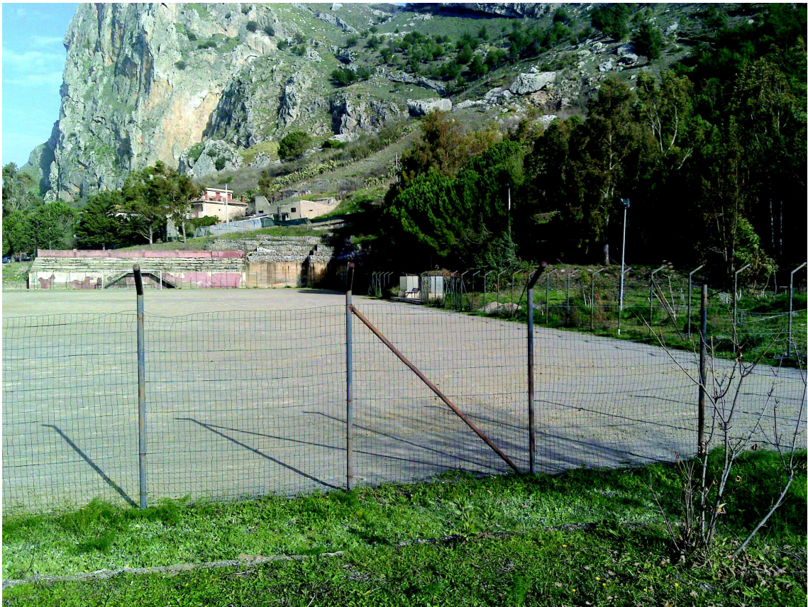
foto n. 3 - scorcio nord-est del campo