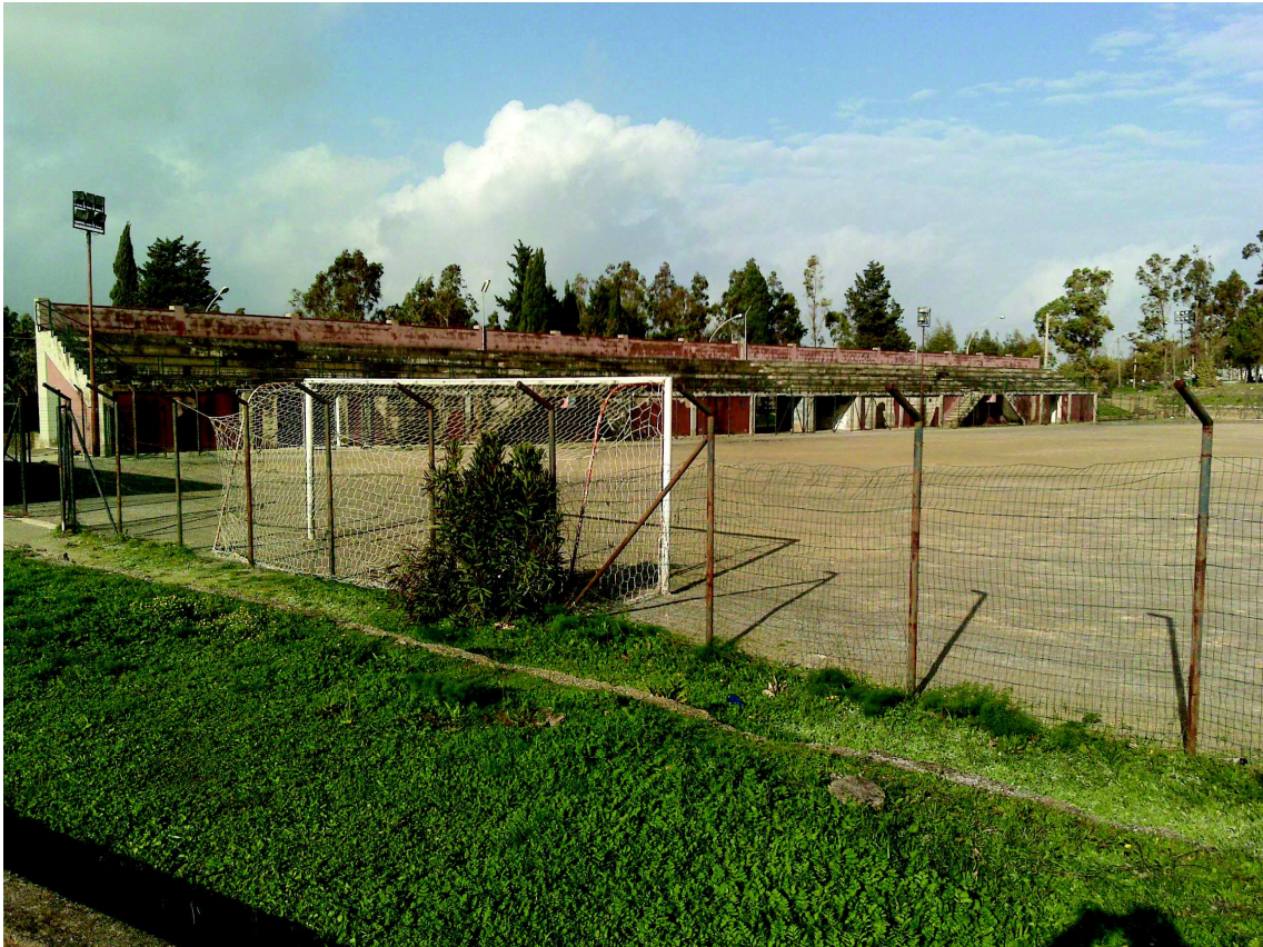
foto n. 1 - scorcio ovest del campo