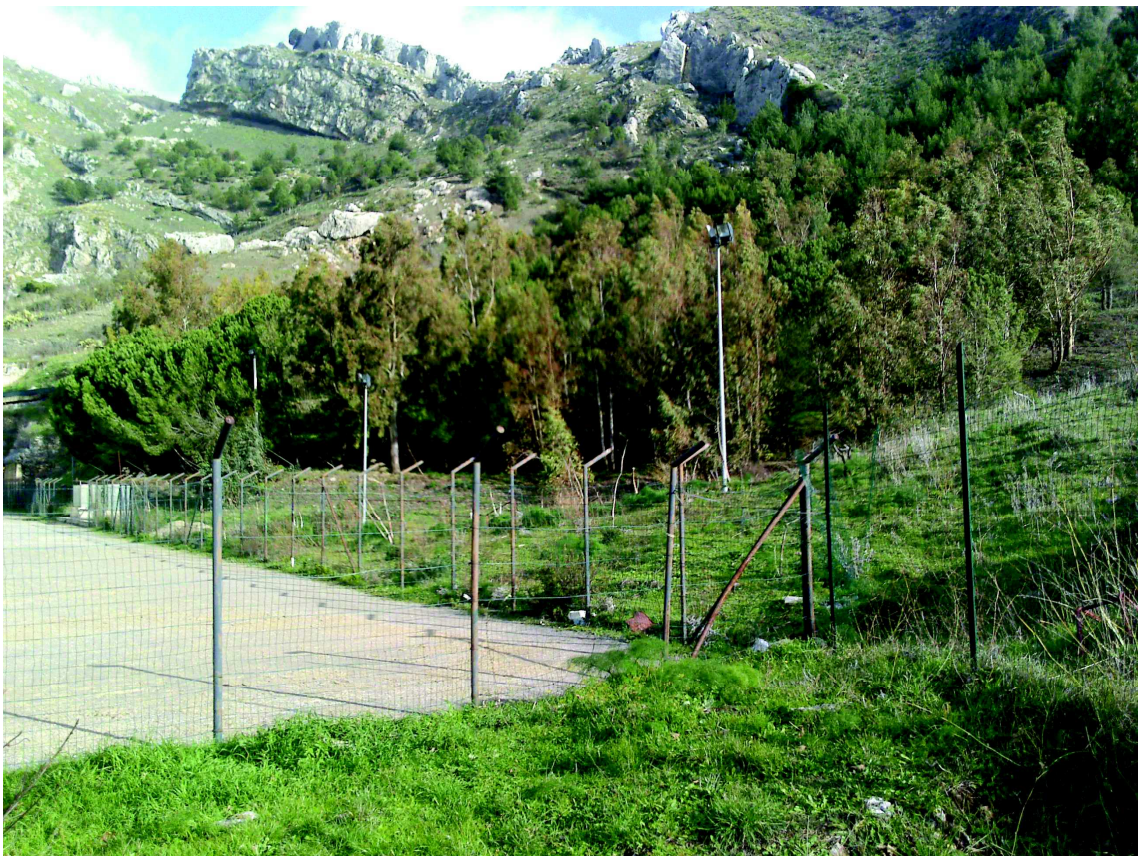
foto n. 4 - scorcio est del campo