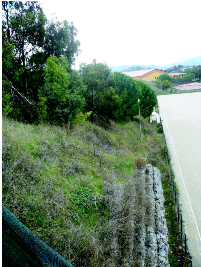
foto n. 10 - scorcio lato est del campo