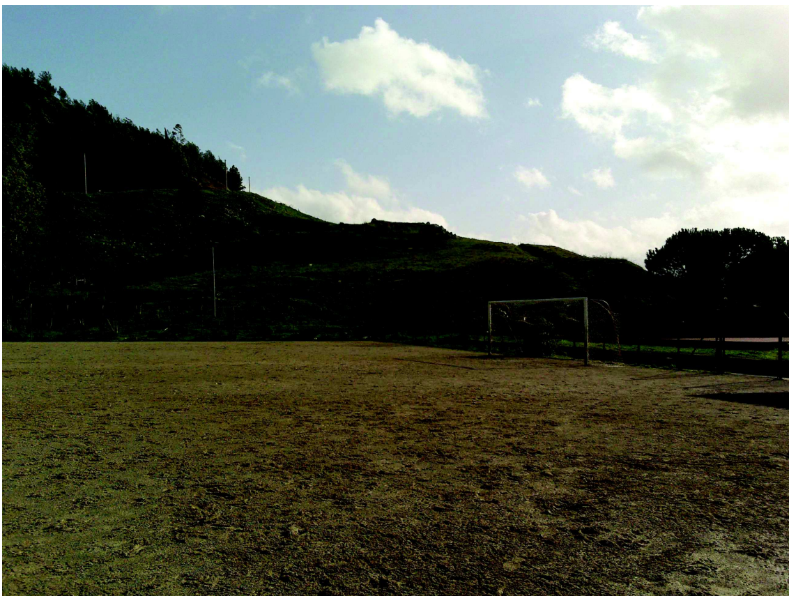
foto n. 6 - scorcio sud-est del campo