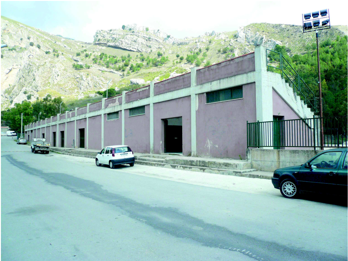
foto n. 9 - scorcio tribuna ovest da strada pubblica