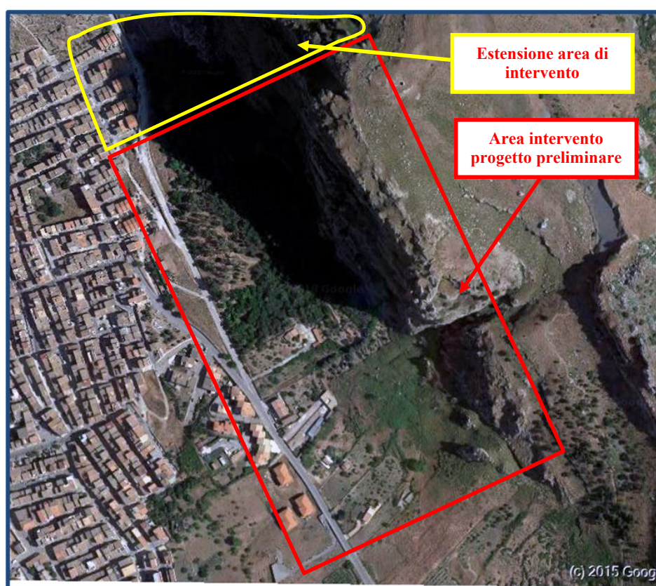
Fig. 1 - Vista aerea dell'area degli interventi

In data 13/3/2019 il progetto è stato consegnato. Con PEC del 5/02/2021 l'Amministrazione ha richiesto una revisione del quadro economico. Pertanto, con la presente è stato rimodulata la stima sommaria dell'importo dei lavori e il relativo quadro economico estendendo l'intervento verso nord a salvaguardia di quella parte di abitato non compresa nel progetto preliminare consegnato (Fig.1).